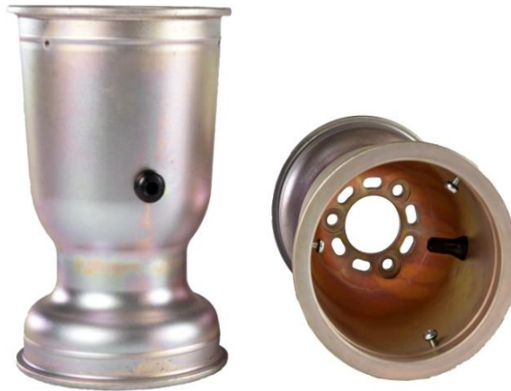
OPZIONAL WHELL SK1 (OPTIONAL)